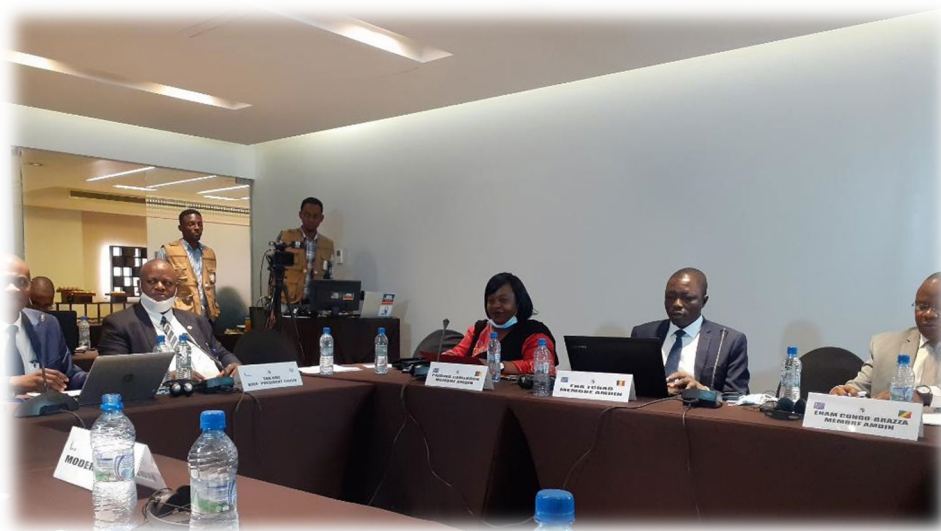
Les participants en pleine séance de travail

Dans un exercice participatif, les quatre membres de la Région Afrique Centrale présents à la rencontre ont relevé les problèmes suivants :