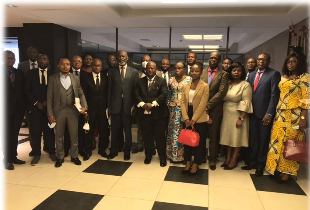
Participants à la séance d'ouverture solennelle de la réunion AMDIN RAC