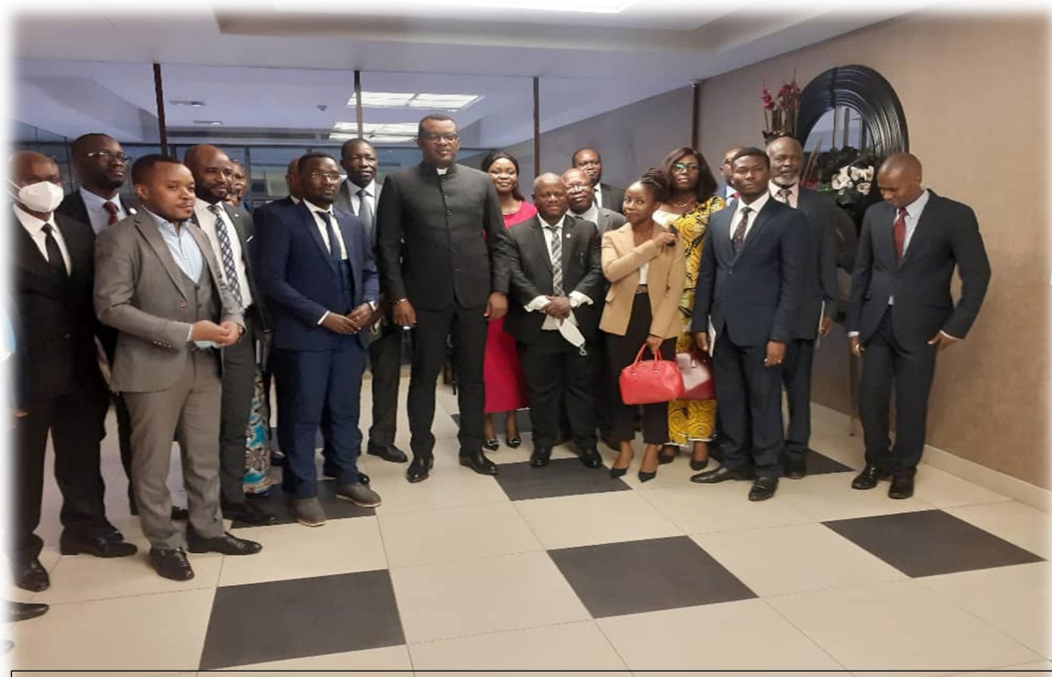
Photo de famille : VPM Fonction publique, organisateurs, participants et invités

la Réunion ont abordé successivement, et par Ecole ou Institut (MDI) discuté des points repris dans le programme décrit ci-dessus.