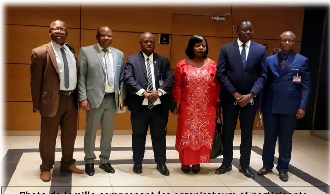
Photo de famille comprenant les organisateurs et participants

Les organisateurs et les participants à la réunion ont pris une photo de famille pour immortaliser l'évènement.